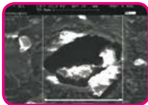
Einspritzöffnung ohne Xtreme nach Langzeittest