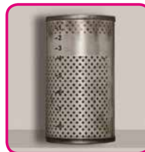
Diesel-Kraftstofffilter mit Xtreme nach 50.000 km