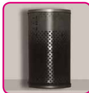
Diesel-Kraftstofffilter ohne Xtreme nach 20.000 km

Auch das optimale Kaltstartverhalten durch eine verbesserte Cetanzahl sowie ein saubereres Kraftstoff-Filterssystem sprechen für die Premium-Qualität.