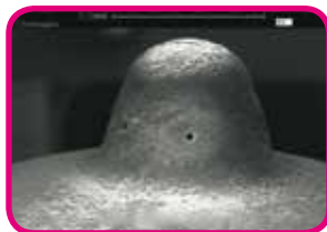
Einspritzdüse mit Xtreme nach Langzeittest