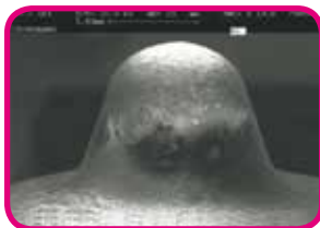
Einspritzdüse ohne Xtreme nach Langzeittest

Profitieren Sie von einem überlegenen Wirkungsspektrum und nutzen Sie dauerhaft das gesamte Leistungspotenzial Ihres Dieselfahrzeugs für mehr Fahrspaß und Zuverlässigkeit. Xtreme Diesel verbrennt effektiver und sauberer als herkömmlicher Diesel. Das schützt Ihren Motor vor schädlichen Ablagerungen – und bereits vorhandene Rückstände können langfristig reduziert werden.